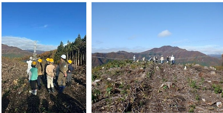
(写真は体験学習での風景)