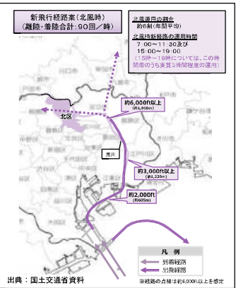
<新飛行経路案(北風時・出発機)>

(北風時の出発機について) ・北風運用時における北区上空を通過する飛行ルートは、現行の飛行ルートと同じです。 ・運用時間は7時から11時30分及び15時から19時で、その間は現在より低い高度で飛行すると見込まれます。これ以外の時間は、現行の高度で飛行します。