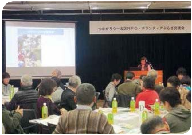
北区NPO・ボランティアぷらざ交流会

一方、区民自らの手で地域の課題を解決しようとするNPO・ボランティア活動団体などが着実に育ってきています。区では、区民活動の推進と協働を促進するための全区的な拠点となる「北区NPO・ボランティアぷらざ」を中心に、区民活動団体の育成、担い手づくり、ネットワークの推進、情報提供など、NPO・ボランティア