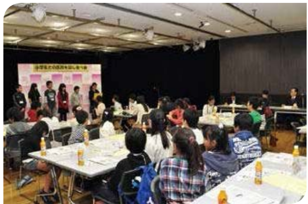
小学生との区政を話し合う会

区はこれまで、主要な計画等を策定する際の審議会の委員の公募、パブリックコメントの実施、重要な施策を進める際の公聴会や説明会の開催、区政モニター会議、中学生・高校生モニター会議、小学生対象の区政を話し合う会、区長の「まちかどトーク」の開催など、一人でも多くの区民が区政に参画できる機会を設けてきました。また、区職員がまちに出て、区民とのワークショップを実施しながら、地域ごとの実情に即したまちづくり事業を推進する取り組みも進めています。今後も、区民をはじめ多様な主体との連携に