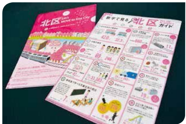
シティプロモーション「数字で見る北区ガイド」

観光の視点からは、観光ガイドマップの発行やイベントの実施など北区の魅力を発信・PRにも努めています。また、区