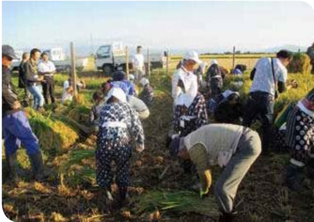
友好都市交流事業「都会っ子ふれあい農業体験」 (山形県酒田市)

環境保全、土壌汚染などの環境問題、都市計画道路の整備、防災対策など、区域を越えた取り組みが必要な課題も少なくありません。このため、区民、企業はもとより、国や東京都、関係団体や他区市町村との幅広い調整と相互連携が重要になります。