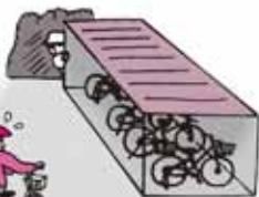
ちゅうりん じょう 駐輪場