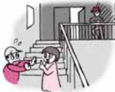
かいだん おど ば 階段の踊り場