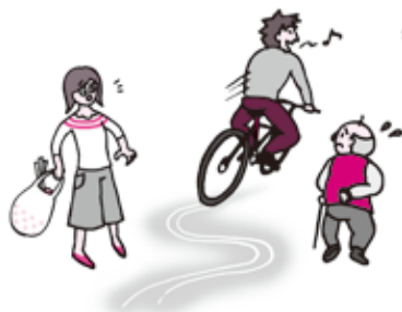
じくざくうんてん ジグザグ運転