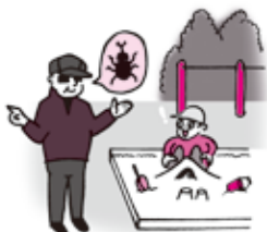
ひと こうえん 人がいない公園