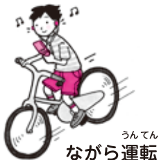
うんてん ながら運転