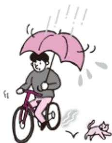
うんてん かささし運転