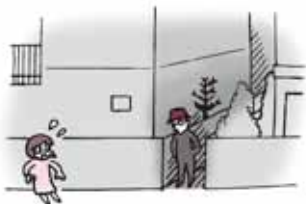
うら どお 裏通り