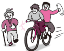
ふたりの 二人乗り