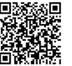
メール配信登録用

HP http://www.ox.kankyo.metro.tokyo.jp/mail.php 【テレホンサービス】 ☎(5640)6880 ☎ 環境課環境規制調査係 ☎(3908)8611