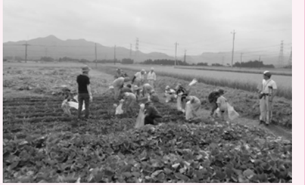
今年の「親子ふるさと体験」の様子

【対】区内在住でおおむね5歳以上の子どもと保護者(家族2～5名程度) 【日】7月26日(金)～27日(土)の1泊2日(26日午前8時区役所を出発、27日午後6時頃区役所で解散予定) 【内】農作物の収穫、そば打ち体験など(収穫物の送料は別料金、食事は1日目の昼食から2日目の昼食まで含み、中之条町まで大型バスで往復) 【宿泊場所】四方温泉ゆずりは荘 ※内容及び宿泊場所は変更する場合があります。 【定】40名程度(抽選) 【費】中学生以上9,000円、小学生以下5,000円 【申】往復はがき(記入例参照。参加人数、全員の氏名・ふりがな・性別・生年月日・年齢も記入)で、6月14日(金)(必着)まで ※家族単位でお申し込みください。 【問先】〒114-8503(住所不要)地域振興課地域振興係 ☎(5390)0092