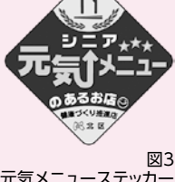
図3 シニア元気メニューステッカー