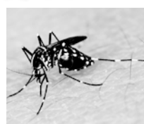
ヒトスジシマカ

区では、区道や区立公園など公共の雨水マスに幼虫の成長を抑える薬剤を散布し、発生総数を減らす対策を行っています。しかし、蚊は小さな水たまりでも、1週間ほど水がたまる場所であれば簡単に発生します。1週間に1度は、次の発生源をチェックし、不要な水たまりはなくしましょう。