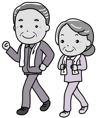
長生きするなら北區が一番