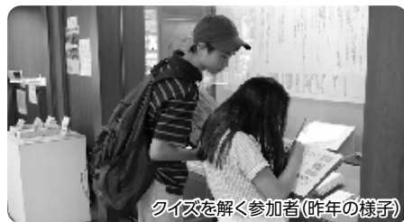
クイズを解く参加者(昨年の様子)

小学3年生~中学生 ※同館職員は同行しませんので保護者同伴をお勧めします。 7月13日(土)~9月1日(日)(休館日を除く) 館内の展示資料をヒントにクイズを解き、田端文士村の謎を解く場所を探します。正解者には記念グッズ(先着50名限定)を贈呈します。 当日、直接会場へ ※駐車・駐輪場は近隣の有料施設をご利用ください。 田端文士村記念館(田端6-1-2)(月曜及び祝日の翌日を除く) ☎(5685)5171