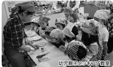
幼児親子クッキング教室

区内在住で4歳~6歳の末就学児(2名まで(兄弟姉妹に限る))と保護者(1名) 8月3日(土) 午後1時~3時30分 健康増進センター(王子5-2-5-101) 調理...お野菜たっぷりすいとんを作ってみよう ※アレルギー物質を含む食材を使用します。詳しくはお問い合わせください。 食育講座...熱中症を予防する食べ方を知ろう 北区楽しい食の推進員会 24名(抽選) 1組500円(3名の場合750円) 往復はがき(記入例参照。参加者全員の氏名・ふりがな・お子さんの年齢も記入)で、7月8日(月)(必着)まで 114-8508(住所不要)健康推進課健康づくり推進係「幼児親子クッキング教室」担当 ☎(3908)9068