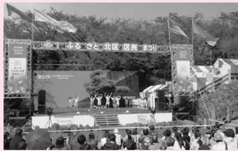
昨年の王子会場での様子

【内】ステージ上での歌、踊り、楽器演奏など。ヒップホップやストリートダンスなども大歓迎です。 ※赤羽会場は太鼓・エレキギター・ドラム、滝野川会場はエレキギター・ドラム不可など会場により制限があります。 【費】1グループ5,000円 ※昨年と参加料が変更となっています。