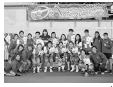
横河武蔵野アルテミ・スターズ

【時間】午後1時50分~2時30分(受付は午後1時10分~1時40分) 場 メインアリーナ 師 横河武蔵野アルテミ・スターズ 定 ②20組(抽選) ④40名(抽選)