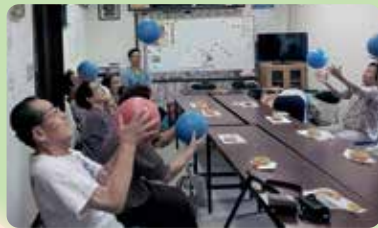
町会・自治会サロン活動

高齢者が地域で長く安心して生活できるように、町会・自治会による一人暮らし高齢者などの見守り活動やサロン活動、また高齢者あんしんセンター、医療機関や店舗などとも連携を図り、見守り・支えあい活動を行っています。 ☎高齢福祉課高齢相談係 ☎(3908)9083 ☎長寿支援課 ☎(3908)9017