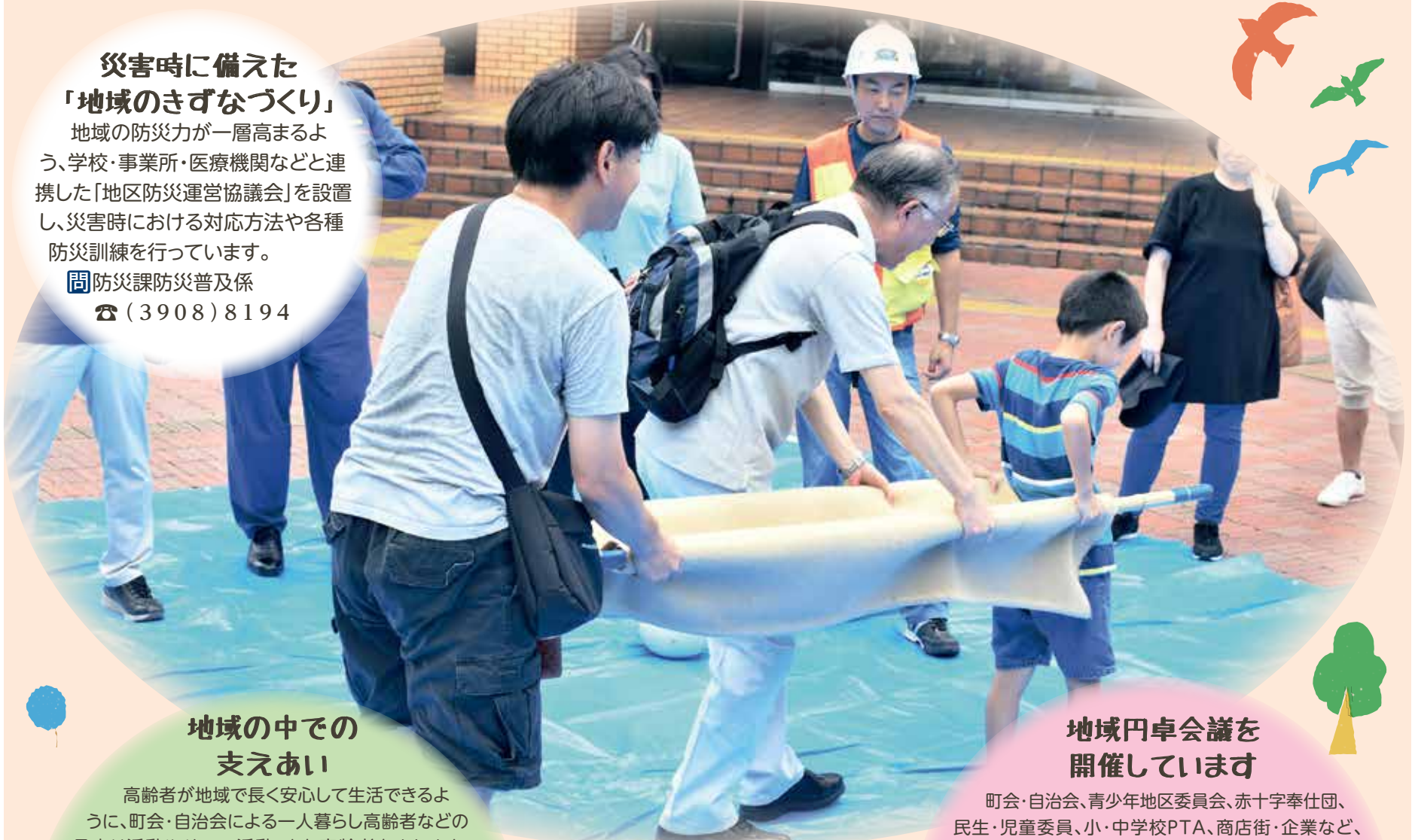
警察・消防・北区等合同災害訓練

災害時に備えた「地域のきずなづくり」 地域の防災力が一層高まるよう、学校・事業所・医療機関などと連携した「地区防災運営協議会」を設置し、災害時における対応方法や各種防災訓練を行っています。 ☎防災課防災普及係 ☎(3908)8194