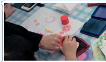
ふじこの絵本塾ワークショップ(昨年の様子)