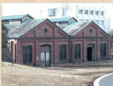
図書館になる前の赤レンガ棟

対 区内在住、在勤、在学の方優先 日 11月2日(土) 午後2時～4時 師 國學院大学講師 黒川徳男氏 定 50名(抽選) 申 往復はがき(記入例参照)で、10月17日(木)(必着)まで ※視覚・聴覚障害のある方は電話、ファクスでも申込可 ※手話通訳が必要な方は事前に連絡してください。 問 場 先 〒114-0033 十条台1-2-5 中央図書館図書係 ☎(5993)1125 FAX(5993)1044