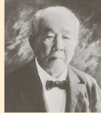
渋沢栄一翁肖像

区では、北區渋沢栄一プロジェクトを立ち上げ、2024年の紙幣刷新に向けて機運を醸成する取り組みを開始しています。各種イベントや北區と渋沢翁について詳しくは、特設ホームページをご覧ください。