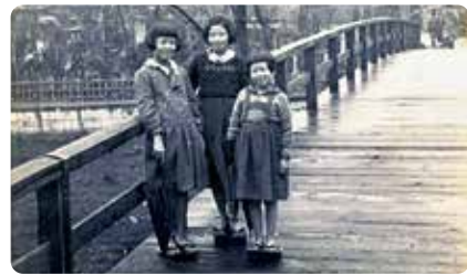
昭和10年代