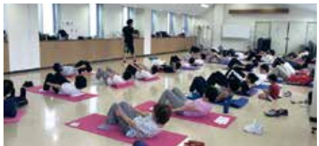
はじめての体幹トレーニングの様子