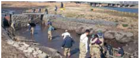
かいぼり体験の様子

日10月12日(土)～16日(水) 午前10時～正午(小雨決行) 場荒川右岸河川敷(赤羽3-29先新荒川大橋脇) 内ピオトープ池の生物観察(12日のみ)、干潟の清掃活動や池の底泥洗い出し作業などを体験・見学します。 申当日、直接会場へ ※汚れてもよい服装でお越しください。 問道路公園課公園河川係内北区・子どもの水辺協議会事務局 ☎(3908)9275 [当日連絡先] ☎090(4916)1322