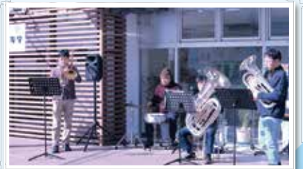
リレーライブ(昨年の様子)