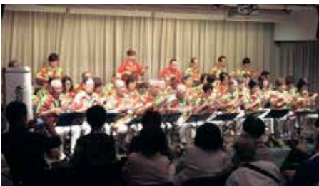
昨年の赤羽文化センターまつりの様子

主催 赤羽文化センター利用団体連絡協議会 日10月19日(土) 午前10時～午後5時30分・20日(日) 午前10時～午後4時 内作品展示…手工芸、美術、書道など 実演…楽器演奏、コーラス、舞踊など 体験発表…お茶席(一席400円)など ※詳しくはホームページをご覧ください。 申当日、直接会場へ 問場赤羽文化センター(赤羽西1-6-1-301) ☎(3906)3911 HPhttp://www.kita-bunka.com