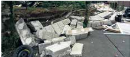
平成28年熊本地震によるブロック塀の倒壊