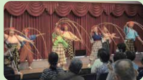
ステージイベント(南京玉すだれ)