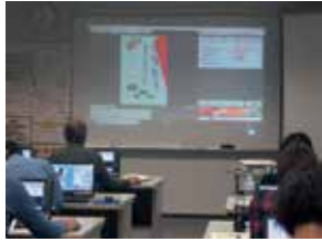
みんなのパソコンひろばの様子

対 区内在住、在勤、在学でWindowsの基本操作と文字入力のできる方 日 12月5日(木) 午後6時30分～8時30分 内 パソコン相談とミニセミナー「はがきデザインキットで年賀状作成」 師 堀 愛弓氏 定 14名(抽選) 費 1,650円(受講料、テキスト代含む) 申 往復はがき(記入例参照)、直接窓口、ホームページまたは下記申込コードから11月21日(木)(必着)まで 問 場 先 〒115-0055 赤羽西1-6-1-301 赤羽文化センター ☎(3906)3911 HP http://www.kita-bunka.com/web/ko-web.html 申込コード