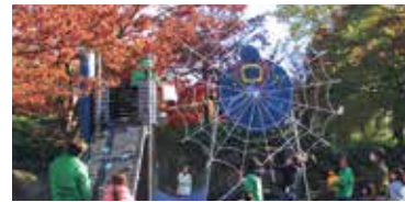
親子でチャレンジ飛鳥山 昨年の様子