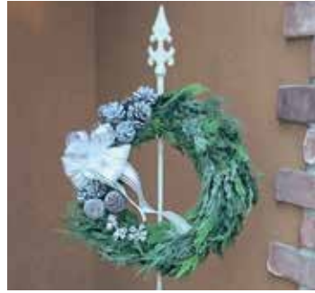
アレンジメントデザイン例

対 18歳以上の方 日 11月28日(木) 午後7時～8時30分(6時45分受付開始) 内 green&whiteの大人のXmasリースを作ります。 定 20名(申込順) 費 3,900円(花材代含む) 申 11月1日(金)から21日(木)までに電話または直接窓口で申込 ※申込締切後のキャンセルはできません。 ※花材は若干入れ代わることがあります。 問 場 先 赤羽会館 ☎(3901)8121