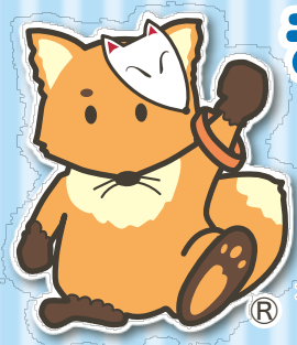
北区認知症支援キャラクター「こんちゃん」