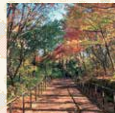
赤羽自然観察公園