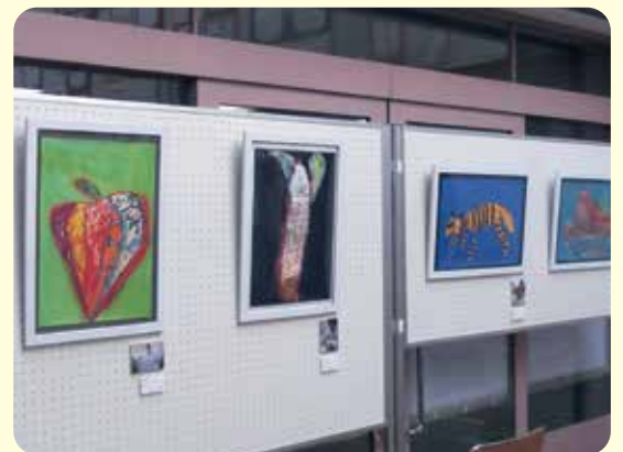
大型作品の展示(平成30年度)