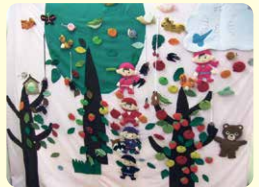
布の絵本(ちいさなさかなの会)