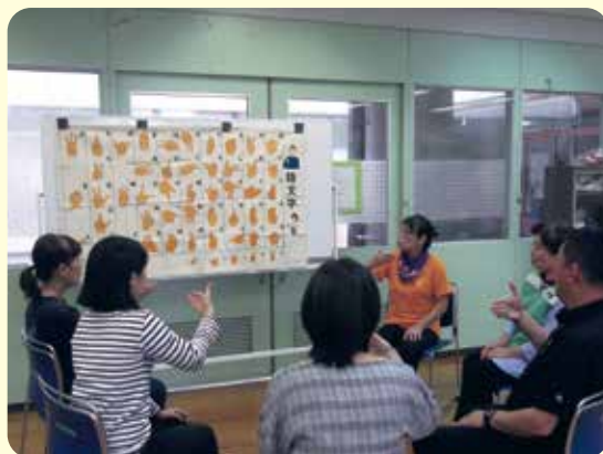
手話体験もできます