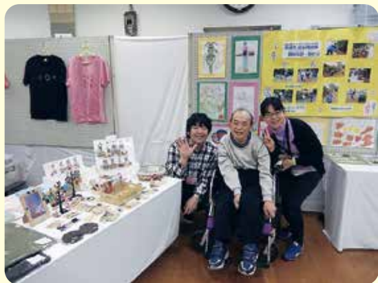
赤羽西福祉工房のブース