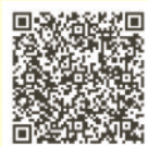
ふれあいマルシェ ホームページ