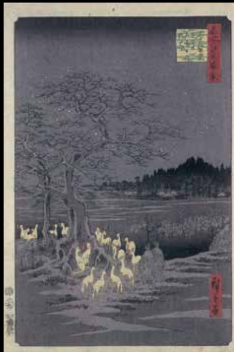
歌川広重「名所江戸百景 王子装束の木 大晦日の狐火」(北区飛鳥山博物館所蔵)

主催 王子狐の行列の会 詳しくはホームページをご覧ください。 HP http://kitsune.tokyo-oji.jp/