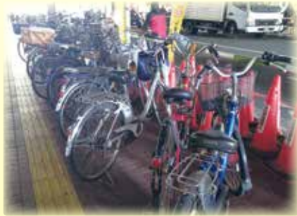
点字ブロックを塞ぐ放置自転車

自転車が路上に放置されると、歩行者の通行障害となり、特に車イスの方や目の不自由な方などにとっては、わずかな時間でも大変危険なものとなります。また、交通事故の原因や災害の際の避難、消防活動等の妨げにもなりかねません。