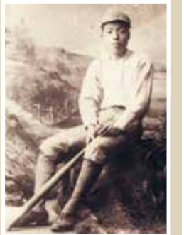
ユニフォーム姿の正岡子規 松山市立子規記念博物館所蔵

「野球の歴史と田端文士たち～正岡子規、押川春浪、サトウハチローほか～」 日 3月22日(日) 午後2時開演(1時30分開場) 内 野球が好きだった正岡子規、サトウハチローのエピソードや、田端文士とオリンピックのことなどを幅広くお話しします。 師 野球殿堂博物館 井上裕太氏 定 100名(抽選) 申 往復はがき(記入例参照。2名の場合は間柄も記入)で、3月2日(月)(必着)まで ※1通1名。同居家族に限り1通2名まで 問 場 先 〒114-0014 田端6-1-2 田端文士村記念館K係 ☎(5685)5171 ※駐車・駐輪は隣接の有料施設をご利用ください。