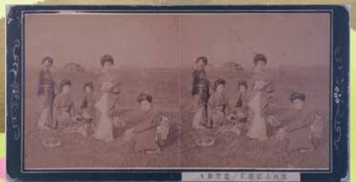
立体写真「荒川上流浮間／桜草取り」

赤羽駅が開業すると、列車に乗って訪れる人々が増え、浮間の桜草が有名となりました。このころには、桜草を持ち帰る人が増え、帰りの列車には桜草を手にした人でいっぱいだったそうです。