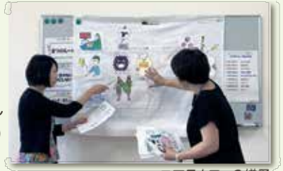
コアラカフェの様子

問先 帝京大学医療技術学部看護学科帝京けんこうひろばプロジェクト(板橋キャンパス教務課)(板橋区加賀2-11-1) ☎(3964)7051