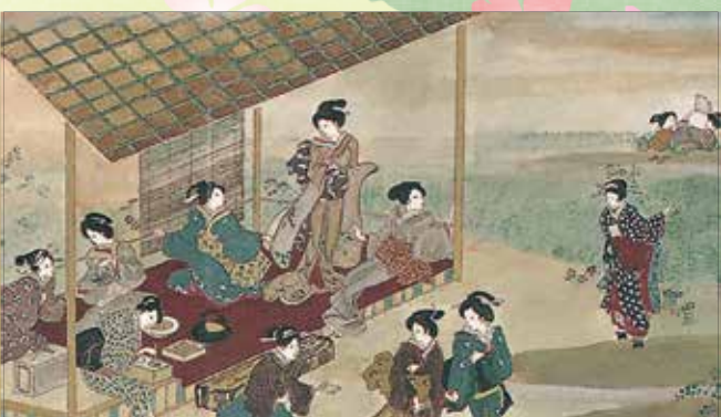
江戸時代の浮間ヶ原を想像して描かれた風景画