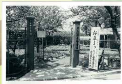
さくら草祭り開催(昭和40年)

桜草の減少を憂えた当時の園芸組合員が、庭先に植えてあった桜草を持ち寄り、栽培を開始。昭和40年からさくら草祭りを開催しています。