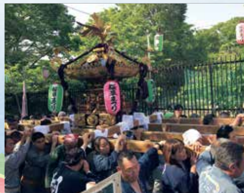
浮間さくら草祭り神輿パレード