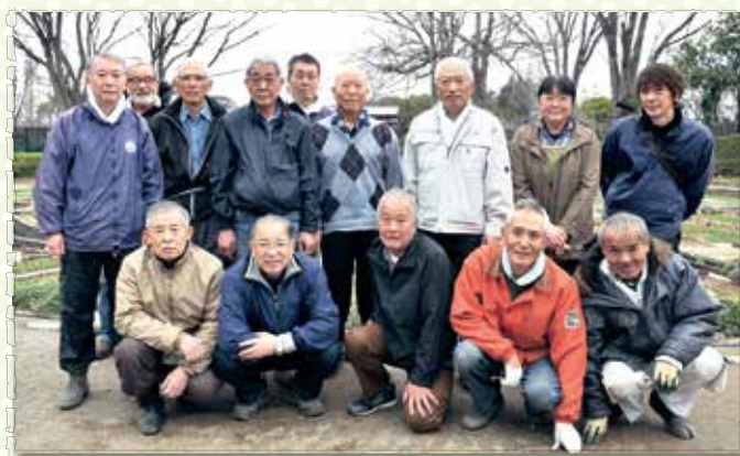
ある日の作業に集まった会員の皆さん