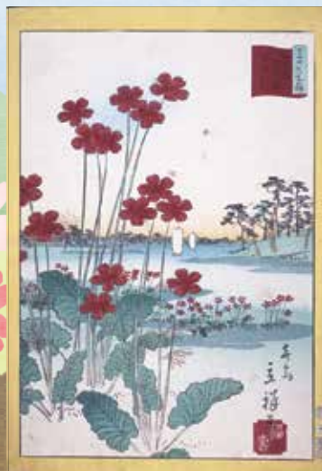
東京三十六花撰 東京戸田原さくら草