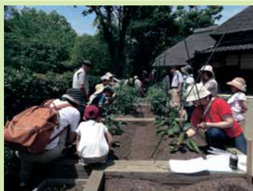
春野菜作りの様子