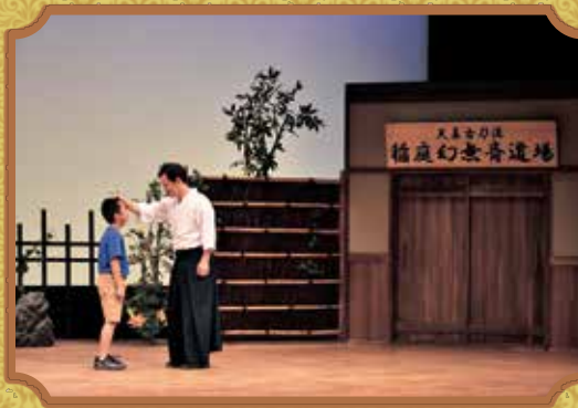
◀ 第16回大賞受賞作品「妖剣」