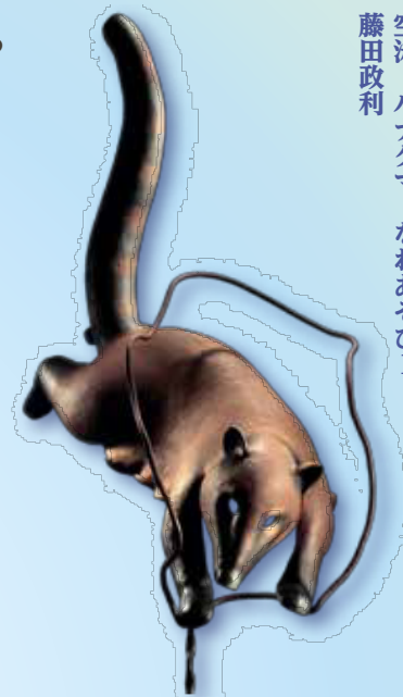
〔鍛金〕 空泳ハナグマ・なわあそび1 藤田政利