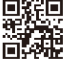
(福)奉優会 ホームページ