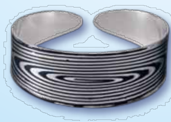
〔彫金〕 銀赤銅渦巻プレスレット 藤江聖公