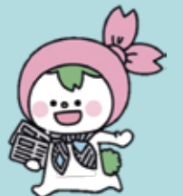
マスコットキャラクター うさNIE

問先〒114-8546(住所不要)教育指導課「第8回比べて読もう新聞コンクール」係 ☎(3908)9287