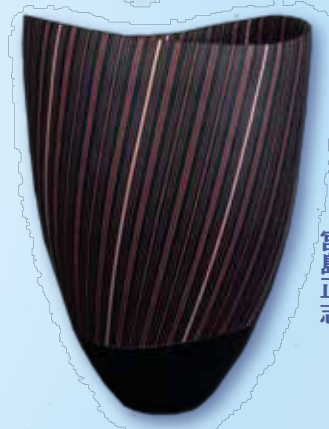
〔陶芸〕 黒彩縞紋の器 宮島正志