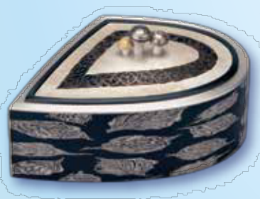
〔彫金〕 重ね金香炉「秋の里山」 浅井盛征