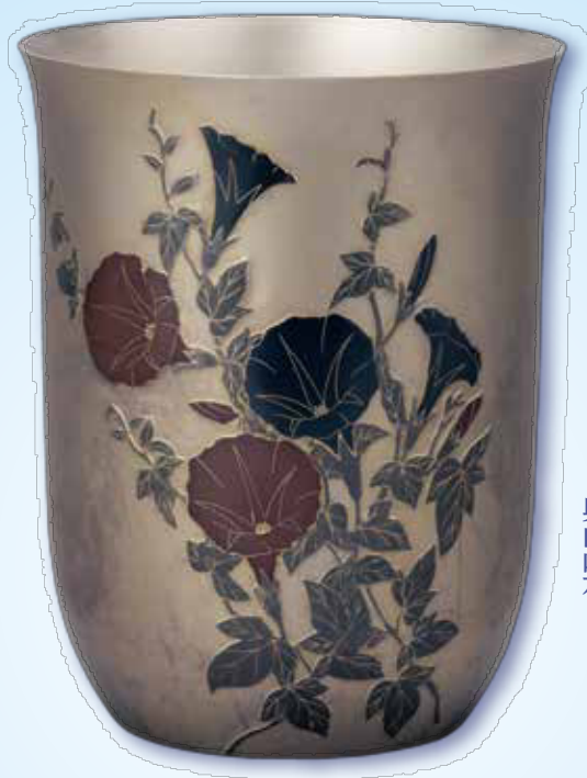
〔鍛金〕 接ぎ合せ朝顔文花器 奥山峰石