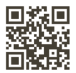
北区スポーツ 推進委員協議会