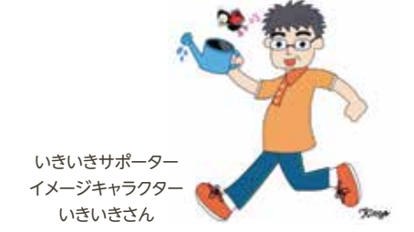
いきいきサポーター イメージキャラクター いきいきさん

対区内在住で65歳以上の方 日12月16日(水) 午後2時30分～4時 場北区NPO・ボランティアぷらざ交流コーナー(北とびあ4階) 内いきいきサポーター受入施設でのボランティア活動時間に応じて交付金(上限あり)を申請できる制度について説明後、希望者の登録申請を行います。 ※当日はマスクを着用し、検温を済ませてご参加ください。 [持ち物]介護保険被保険者証 定8名(申込順) 申11月17日(火)午前10時から電話申込 問先NPO法人東京都北区市民活動推進機構(北区NPO・ボランティアぷらざ内)(月曜、祝日休館) ☎(5390)1771