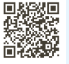
国税庁確定申告書等作成コーナー