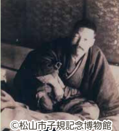
明治31年 病床上で仕事を続ける正岡子規