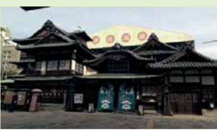
子規や親友・夏目漱石も訪ねた松山道後温泉