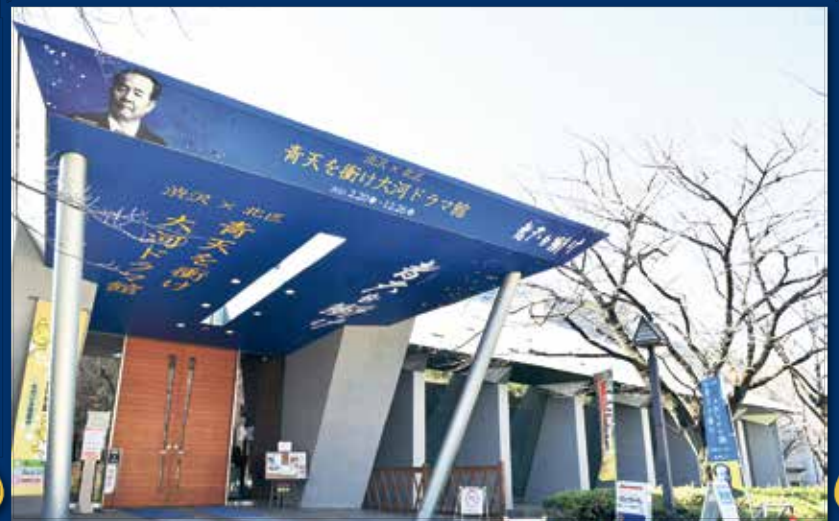
大河ドラマ館外観