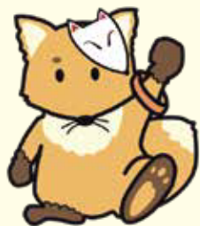
北区認知症支援キャラクター「こんちゃん」

認定者数の推計やサービス供給見込量、介護給付費準備基金の活用をもとに算出した第1号被保険者の所得段階別介護保険料基準額は、右表のとおりです。なお、所得状況に応じた保険料設定とするため、第7期と同様に16段階とします。