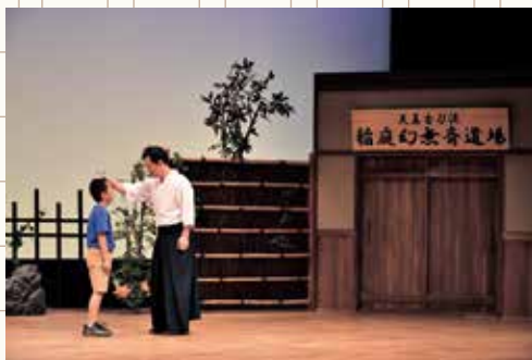
第16回大賞受賞作品「妖剣」