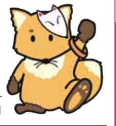
北区認知症支援キャラクター「こんちゃん」

講座・催しなどを往復はがき・ファクス・Eメールなどで申込み場の場合の記入例は6面をご覧ください