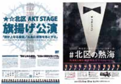
★☆北区AKT STAGE公演ポスター展