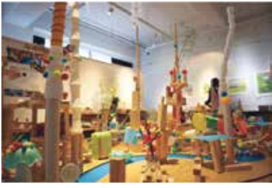
理想のキタクなるまちをつくろう(一昨年の様子)

ココキタで日々活動しているレジデンスアーティストや、アーティストバンク登録者の展示を中心にココキタを盛大に飾ります。 ※詳しくは、チラシ、ホームページをご覧ください。 日 5月22日(土)～5月30日(日) 午前10時～午後8時(最終日は午後5時まで) 内 展示「History of Dctpeppers Theatre ～ココキタで生まれた作品たち～」 「★☆北区AKT STAGE公演ポスター展」 「『キタクなるまちをつくろう』のつづき」ほか 問場 北区文化芸術活動拠点ココキタ(北区豊島5-3-13)(月曜休館) ☎(6338)5711 HP https://kitabunka.or.jp/cocokita