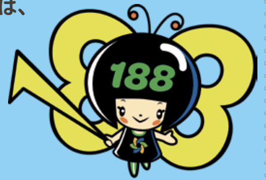
イメージキャラクター イヤヤン

※電話機のタイプにより☎188につながらない場合は、☎0570(064)370へおかけください。