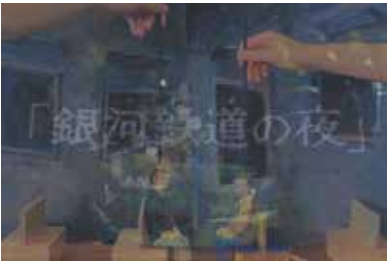
「銀河鉄道の夜」上演 ほか