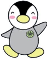
東京都民生委員・児童委員イメージキャラクター ミンジー

民生委員・児童委員は厚生労働大臣から委嘱されます。地域の皆さんから福祉に関する相談を受け、その相談内容に応じて区の窓口や関係機関を紹介し、適切なサービスが受けられるよう支援を行っています。また、地域の子どもや子育て家庭をあたかくサポートしています。主任児童委員は子どもたちの問題を専門的に担当します。