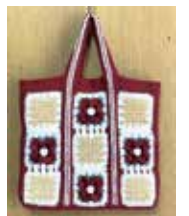
クリスマスツートバッグ見本