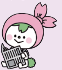
マスコットキャラクター うさNIE