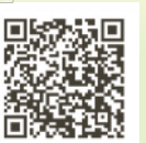
北区人権週間 記念事業 ホームページ