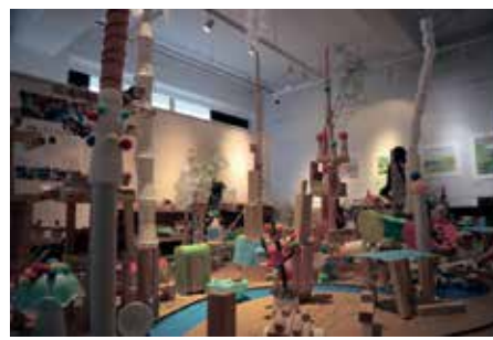
「キタクなるまちをつくろう」のつづき(参加型展示)