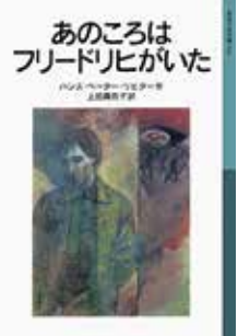
「あのころはフリードリヒがいた」 ハンス・ペーター・リヒター/作 上田真而子/訳 岩波書店

日 12月11日(土) 午後1時30分~3時 場 中央図書館3階ホール(十条台1-2-5) 内 参加者同士で課題本についての感想を話し合います。