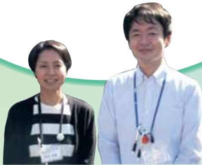
高齢者あんしんセンター職員