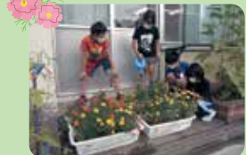
滝野川第四小学校