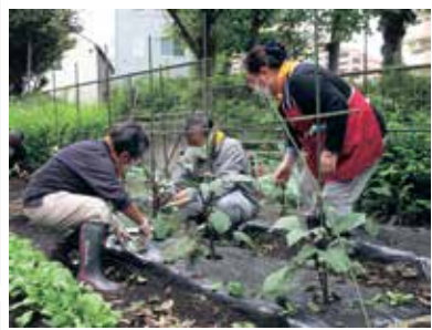
桐ヶ丘やまぶき荘高齢者あんしんセンター 「園芸サロン」のひとコマ