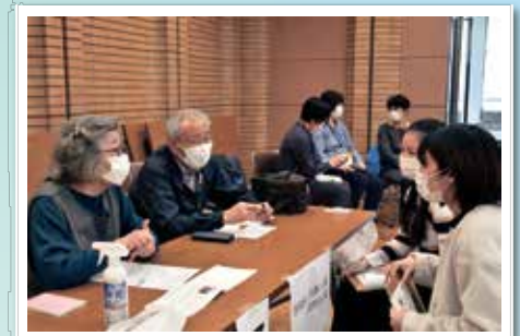
～令和3年度赤羽圏域の様子～

今年は世代を超えた知恵と協力で活動が充 実することを期待して、東洋大学生と地域 の活動団体のマッチングの場を作りました。