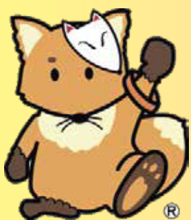
北区認知症支援キャラクター 「こんちゃん」