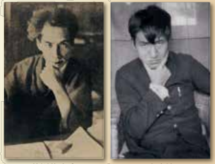
芥川龍之介 太宰治

内芥川龍之介生誕130年を記念する特別企画として、田端文士村記念館・太宰治展示室三鷹の此の小さい家・新宿歴史博物館で芥川と太宰をテーマとした協働企画展示を開催します。当館では、二人の文学資料をはじめ、芥川に憧れる太宰と、太宰に憧れる芥川の息子のエピソードなど、さまざまな角度から2人をご紹介します。また会期中には、「河童忌・桜桃忌スタンプラリー」を開催し、各館で参加賞の葉をお渡しします。また、全3館のスタンプを集めた方には、特別な葉もプレゼント(葉は全て先着1,000名。各館休館日を除き、受付にてお渡しします)。