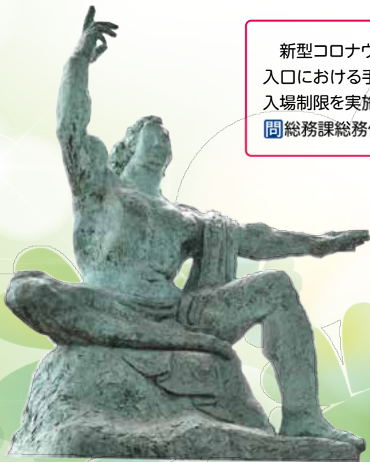
「平和祈念像」北村西望作(北とびあ前)

新型コロナウイルス感染症予防対策として、マスクの着用及び入口における手指消毒にご協力ください。なお、混雑状況により入場制限を実施する場合があります。 ☎総務課総務係 ☎(3908)8623