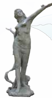
「平和の女神像」北村西望作(飛鳥山公園)

この事業を通じて、あらためて区民の皆さんに「平和都市宣言」の趣旨をご理解いただくとともに、「平和」について祈り、考え、行動する契機にしていただきたいと思います。