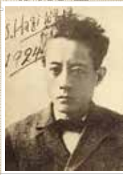
▲萩原朔太郎 ©国立国会図書館

日 10月16日(日) 午後1時開演(0時30分開場) 定 50名(抽選) 申 往復はがき(記入例参照。2名の際は間柄も記入)または申込フォームで、9月26日(月)(必着)まで ※1通1名。ただし同居家族に限り1通で2名まで応募可。 問 場先 〒114-8523 田端6-1-2 田端文士村記念館K係 ☎(5685)5171