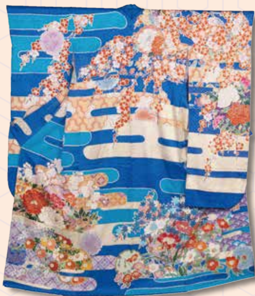
東京手描友禅 佐藤信男 「霞取り四季草花尽くし模様振袖」