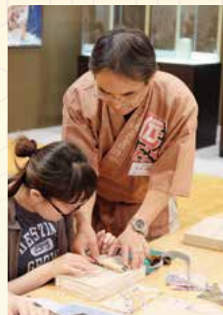
江戸表具(ミニ屏風づくりの様子)