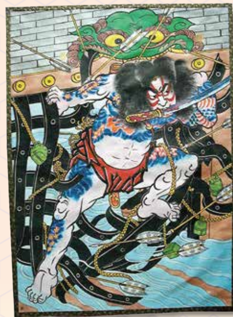
江戸文字風絵 志村康夫 「(水許伝)張順水門破り」