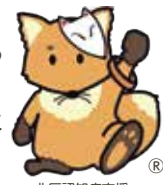
北区認知症支援キャラクター「こんちゃん」