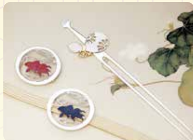
銀細工 小島信重・信一 「銀製 帯留 金魚(素銅・赤銅)、銀製 瓢箪のかんざし」