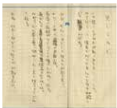
萩原朔太郎 「見しらぬ犬」詩稿