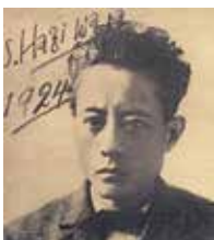
萩原朔太郎

① 朔太郎・犀星・龍之介の友情と詩的精神～タバタニサクタロウキタリ～ 日 10月1日(土)～令和5年1月22日(日) ※休館日を除く 内 萩原朔太郎と室生犀星の初公開資料や芥川龍之介の原稿等の貴重な資料を展示し、田端における3人の友情エピソードや互いの批評などを紹介します。 ② 朔太郎、龍之介、ときどきマジック? 日 12月11日(日) 午後2時開演(1時30分開場) 内 萩原朔太郎の詩の魅力等を知る上記企画展の関連講演会。朔太郎の趣味であったマジック 申込はこちらの実演付きです。 師 栗原飛宇馬氏 定 50名(抽選) 申 上記コードまたは往復はがき(記入例参照)で、11月21日(月)(必着)まで ※1通1名。同居家族に限り2名まで可 問 場 先 114-8523 田端6-1-2田端文士村記念館K係 電 (5685)5171