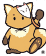
北区認知症 支援キャラクター 「こんちゃん」