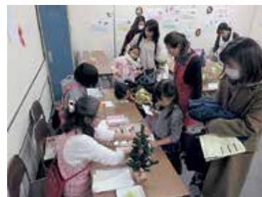
過去のアロマでリラックスの様子