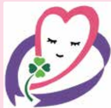
北区パープルリボンシンボルマーク