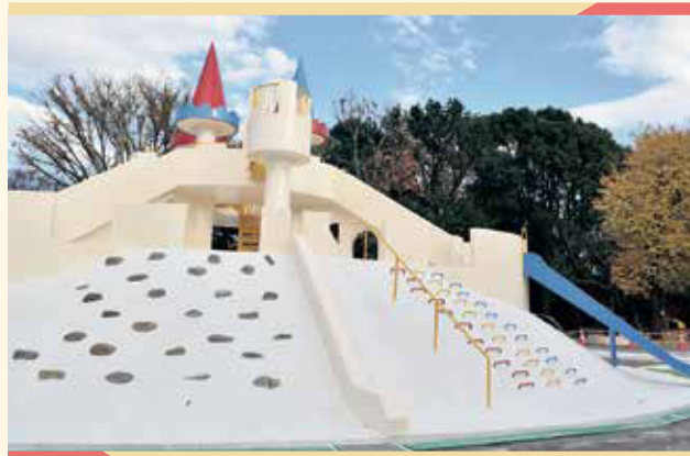
令和2年にリニューアル!大きなお城にのぼったりすべったり。上からSLを探してみよう!