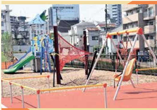
ブランコでたのしく揺れてみよう!ネット遊具もあります。

Point 令和4年4月にオープンしたばかりの南北に長くのびた公園は、遊具がある北エリアと広い草地在り続く南エリアにわかれています。たくさんの動物が隠れている複合遊具やボルダリング付き複合遊具、ネット遊具、さまざまな世代の健康増進につながる健康遊具などがあり、どなたでも楽しめる場所です。また、マンホールトイレ、かまどベンチなど防災用の設備も充実しています!