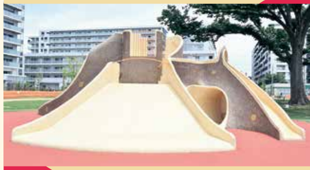
かくれんぼやすべり台もできます!のぼってみると何が見えるかな?