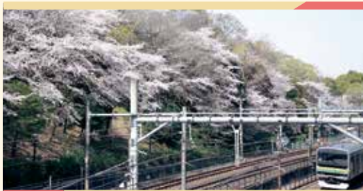
飛鳥山公園はサクラの名所。展望デッキから電車も見えます♪