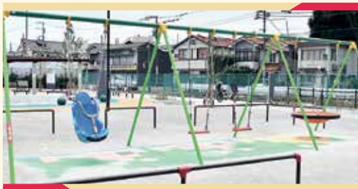
ブランコは3種類設置。みんなで順番に遊ぼう!

Point 切り株をモチーフにした造形遊具は、同時に滑れる大きなすべり台、クライミング、休憩スペースなどが一体となっている大型の遊具です。そのほか、宙を駆けるターザンロープやインクルーシブなブランコ、芝生エリアも人気!いろいろな楽しみ方を見つけてみてください♪