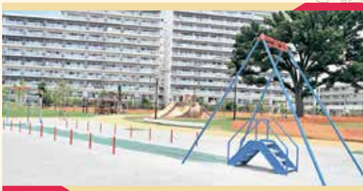
ターザンロープで滑空体験!風をきる感覚が楽しいです♪

Point 切り株をモチーフにした造形遊具は、同時に滑れる大きなすべり台、クライミング、休憩スペースなどが一体となっている大型の遊具です。そのほか、宙を駆けるターザンロープやインクルーシブなブランコ、芝生エリアも人気!いろいろな楽しみ方を見つけてみてください♪