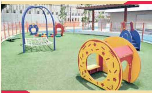
赤ちゃんや乳幼児のお子さんも安心して遊べるエリアです!