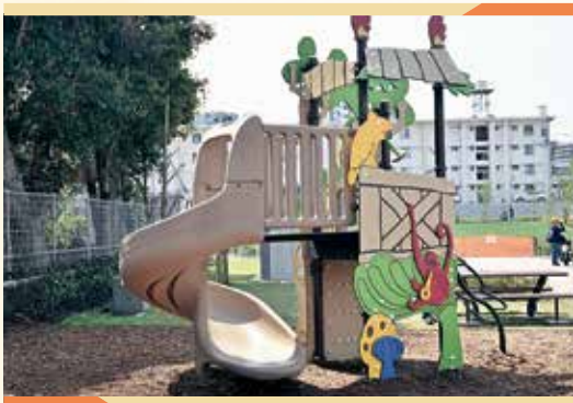
いろいろな動物が隠れています。全部見つけれられるかな?