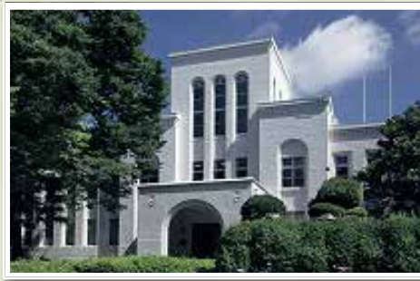
中央公園文化センター