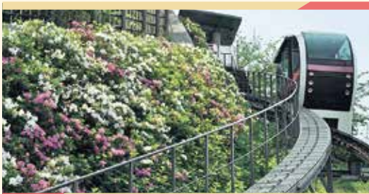
あすかパークレール(通称アスカルゴ)でのんびり頂上へ!

Point 飛鳥山は、上野・芝・浅草・深川とともに日本最初の公園に指定され、令和の現在も「憩いと出会い」の場として親しまれ続けている公園です。遊具広場にはお城の遊具、動物や船の遊具、都電や機関車の展示があり、電車を見下ろせる場所や新幹線がよく見えるデッキも人気のひとつ!高齢者、障害者、ベビーカー利用者でも気軽に登れる自走式モノレール方式の斜行昇降施設「あすかパークレール」もあり、子どもから大人まで存分に楽しむことができます♪