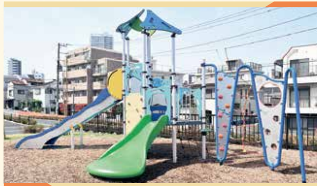
高低差のあるすべり台が2つ、ボルダリングもできます!

Point 令和4年4月にオープンしたばかりの南北に長くのびた公園は、遊具がある北エリアと広い草地在り続く南エリアにわかれています。たくさんの動物が隠れている複合遊具やボルダリング付き複合遊具、ネット遊具、さまざまな世代の健康増進につながる健康遊具などがあり、どなたでも楽しめる場所です。また、マンホールトイレ、かまどベンチなど防災用の設備も充実しています!