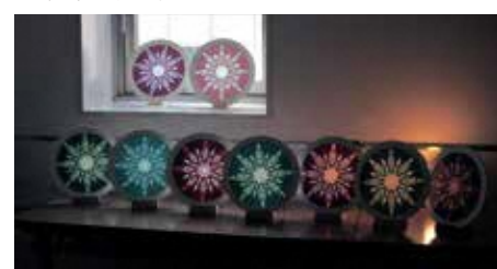
ローズウィンドウ作品

①「ローズウィンドウ」作品展 日6月24日(土)・25日(日) 午前10時～午後4時 内講座参加者が作成した「ローズウィンドウ」を展示します。光と紙が作り出す、ステンドグラスをイメージさせる優しいきらめきをお楽しみください。 ②グリーンサマーコンサートⅧ 日7月2日(日) 午後2時～3時30分(1時30分開場) 内学校でも歌われている合唱曲も含めて、宗教曲からディズニーの映画曲まで、幅広いジャンルの曲を混声合唱団でお届けします。日曜の午後のひと時を、ぜひお楽しみください。 【参加団体】あこや会合唱団 =以下、①②共通= ※混雑状況により入場を制限する場合があります。 申当日、直接会場へ 問場 赤羽文化センター(赤羽西1-6-1-301) ☎(3906)3911