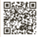
免除制度・納付猶予制度