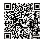
友だち追加はこちら