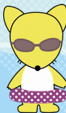
博物館オリジナルキャラクター 「コン吉」(夏Ver.)