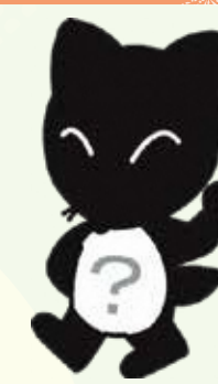
ブラック・コン吉

☑ 小・中学生 日 7月21日金～8月27日日 ☑ 常設展示室に隠れている真っ黒に日焼けした「ブラック・コン吉」を探してクイズに答えると、もれなく景品をプレゼントします。 ☑ 常設展示室観覧料