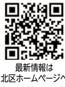
最新情報は 北区ホームページへ