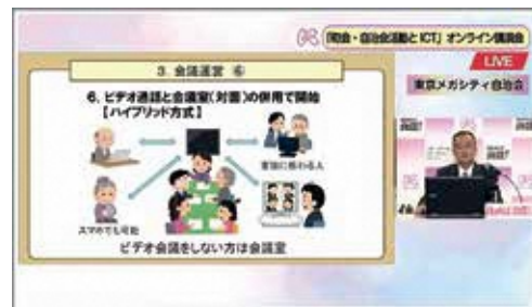
昨年度実施したオンライン講演会の様子

町会・自治会では、ICT機器の導入、SNSやアプリなどを利用したグループ内での情報共有や情報発信、オンライン会議等のコミュニティ活動のデジタル化に取り組んでいます。