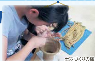
土器づくりの様子