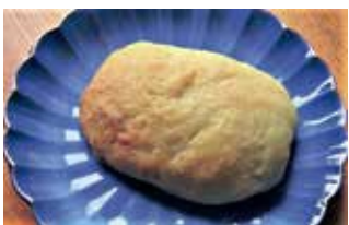
クルミ入り焼き菓子調理例

対区内在住、在勤、在学の方 日7月23日(日) 午後1時～3時 内言語や食文化の話(調理・試食を含む) 師クルド料理レストラン「メソポタミア」オーナー ワッカス チョーラク氏 定15名(抽選) 費700円程度(材料費、保険料) 申往復はがき(記入例参照)で、7月11日(火)(必着)まで 問場先 ☎114-0024 西ヶ原1-23-3 滝野川文化センター(月曜、祝日休館) ☎(5394)1230