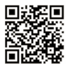
田端宮元自治会Facebookはこちら