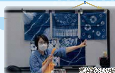
藍染づくりの様子