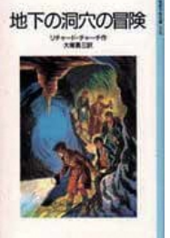
『地下の洞穴の冒険』リチャード・チャーチ/作 大塚勇三/訳 岩波書店

日7月8日(土) 午後1時30分～3時 場中央図書館3階ホール(十条台1-2-5) 内参加者同士で課題本についての感想を話し合います。一人で読むのとはまた違った本の読み方を楽しむ会です。小中高生の参加も大歓迎です。今回の課題本は『地下の洞穴の冒険』(リチャード・チャーチ/作 大塚勇三/訳)です。 【あらすじ】夏休み、ウォルターズ少年は古めかしい洞穴を発見する。未知の洞穴に魅了された秘密クラブの仲間と共に、深い闇の中へと踏み出してゆくのだが…。 申当日、直接会場へ 問中央図書館事業係 ☎(5993)1125