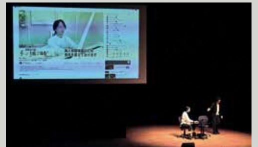
第21回大賞受賞作品「沈黙のコンチェルト」※大賞受賞作品は舞台化の予定です。

問 シティブランディング戦略課(3月31日まではシティプロモーション推進担当課) ☎(3908) 1364