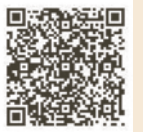
「北区内田康夫ミステリー文学賞」ホームページ

内田康夫氏プロフィール 北区西ヶ原生まれ。昭和55年「死者の木霊」で作家デビュー。作品に登場する名探偵・浅見光彦は北区西ヶ原三丁目在住の設定。小説には北区がたびたび登場。平成8年10月に北区アンバサダー就任。平成14年4月「北区内田康夫ミステリー文学賞」を創設。平成20年3月日本ミステリー文学大賞受賞。平成30年3月83歳で逝去。