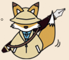
北区内田康夫ミステリー文学賞公式キャラクター「テールズ」

※詳しくは「北区内田康夫ミステリー文学賞」のホームページをご覧ください。下記までお問い合わせください。