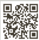
「Webジェイ・ノベル」北区内田康夫ミステリー文学賞特設サイト

※受賞作品は、「Webジェイ・ノベル」(実業之日本社)及びブックレット「扉～第22回北区内田康夫ミステリー文学賞受賞作品～」をご覧ください。なお、ブックレットは、区内各図書館で閲覧できるほか、貸出もしています。また、シティブランディング戦略課窓口や区政資料室などで配布しています(なくなり次第終了)。