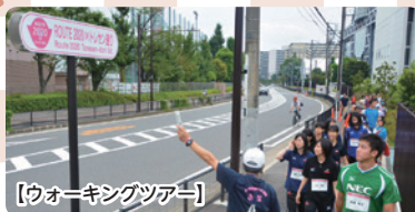
【ウォーキングツアー】

世界の舞台で活躍されているトップアスリートの皆さんがこれからも大きな夢と希望を描き、目標に向かって挑戦し、活躍できるよう応援しています。