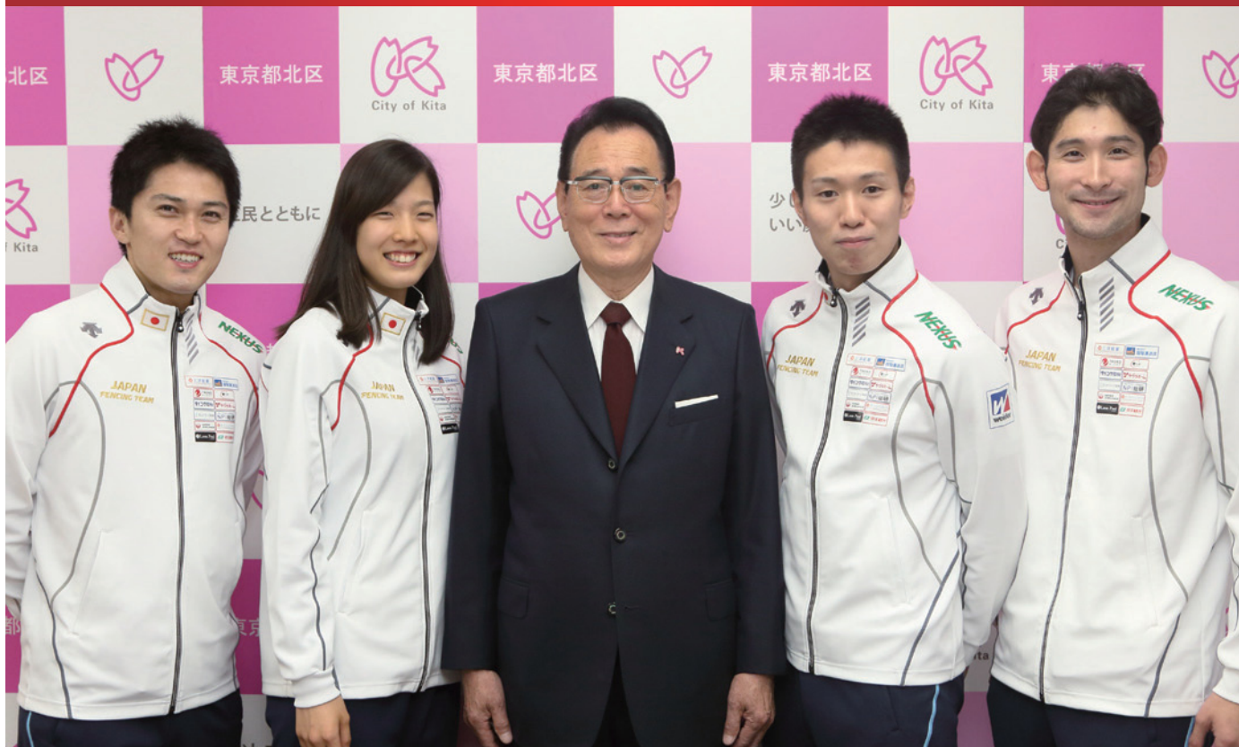
左から千田選手、江村選手、北区長、淡路選手、三宅選手