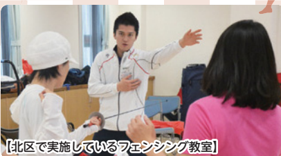
【北区で実施しているフェンシング教室】