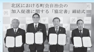
北區における町会自治会の加入促進に関する「協定書」締結式