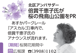
北区アンバサダー 倍賞千恵子氏が 桜の飛鳥山公園をPR

あすカパーフェクト 「アスカルゴ」車内で、 倍賞千恵子氏の アナウンスが流れます。