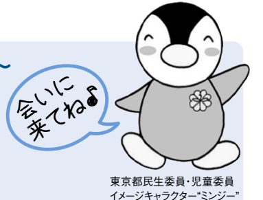
東京都民生委員・児童委員 イメージキャラクター「ミンジー」

日 5月25日(水)~27日(金) 午前10時~午後3時 場 北とぴあ正面玄関横及び1階区民プラザ ※25日・26日(午前11時~正午)は、子ども家庭支援センター(育ち愛ほっと館)(王子2-7-34)にも着ぐるみミンジーが来ます。 問 健康福祉課健康福祉係 ☎(3908)9041