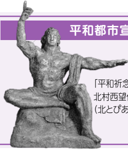
「平和祈念像」 北村西望作 (北とびあ前)

真の平和と安全を実現することは、私たちの願いであるとともに、人類共通の悲願であります。私たちは、日本国憲法に掲げられた恒久平和の理念に基づき、平和で自由な共同社会の実現に向けて努力しています。