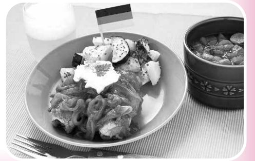
リデュースクッキングで作った ドイツ料理 (調理実習会で実演)

対 2名以上の世帯で、週に2回以上調理をする方 日 ①事前説明会…8月18日(木) 午後1時30分～2時30分 ②調理実習会…9月1日(木) 午前11時～午後1時30分 場 ①赤羽エコ広場館(赤羽1-1-38) ②東京家政大学(板橋区加賀1-18-1) [協力] 東京家政大学 定 40名(抽選) 申 往復はがき、ファクスまたはEメール(記入例参照)で、8月15日(月)(必着)まで ※詳しくは北区ホームページをご覧ください。 問先 〒114-8508(住所不要)リサイクル清掃課リサイクル生活係 ☎ (3908)8538 FAX (3908)1311 EM r-seiso-ka@city.kita.lg.jp