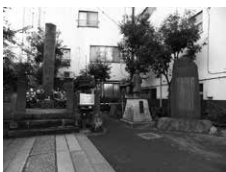
近藤勇と新選組隊士供養塔

日 11月17日(木) 午前9時30分～午後0時30分(9時30分板橋区役所前集合) ※小雨決行、荒天中止 内 北区・板橋区の史跡・観光スポットを両区の観光ボランティアガイドが案内します。 [コース] 平尾宿脇本陣跡、近藤勇と新選組隊士供養塔、寿徳寺、音無さくら緑地、旧醸