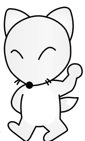
飛鳥山博物館キャラクター コン吉

日11月27日(日) 午後2時～4時 内江戸の庶民が好んで読んだ本の中から、狐が登場する戯作を取り上げます。 師同館学芸員 定80名(抽選) 申往復はがき(記入例参照)で、11月16日(水)(必着)まで 問場先 〒114-0002 王子1-1-3飛鳥山公園内 北区飛鳥山博物館 ☎(3916)1133 (月曜休館)