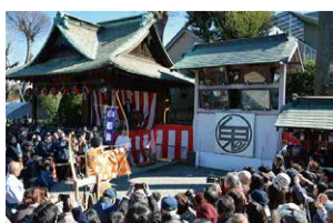
2月 白酒祭(オビシヤ行事)