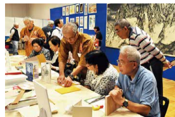
9月 北区伝統工芸展