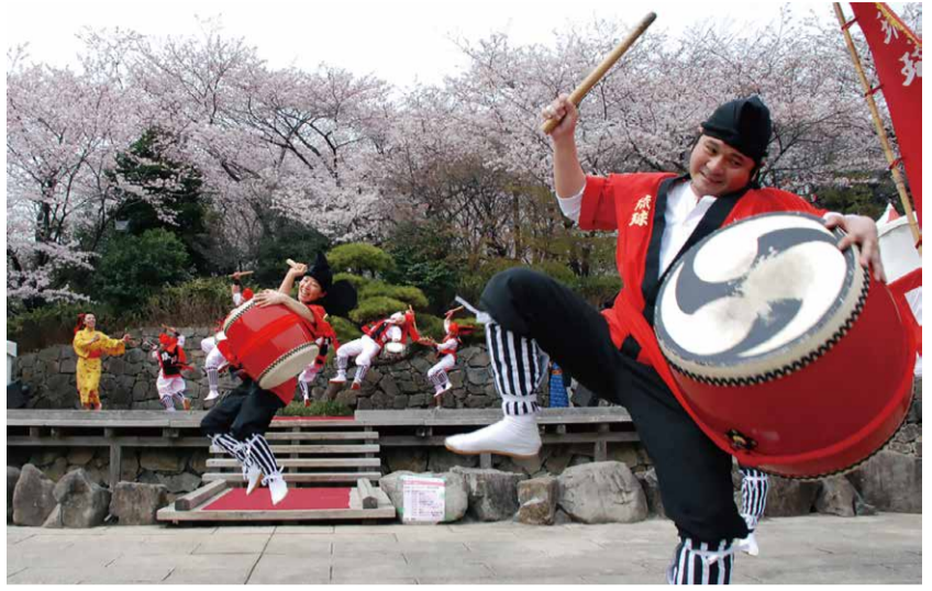
3月 さくらSA*KASO祭り(飛鳥山公園)