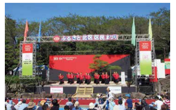
10月 ふるさと北区 区民まつり