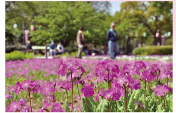
4月 浮間さくら草祭り