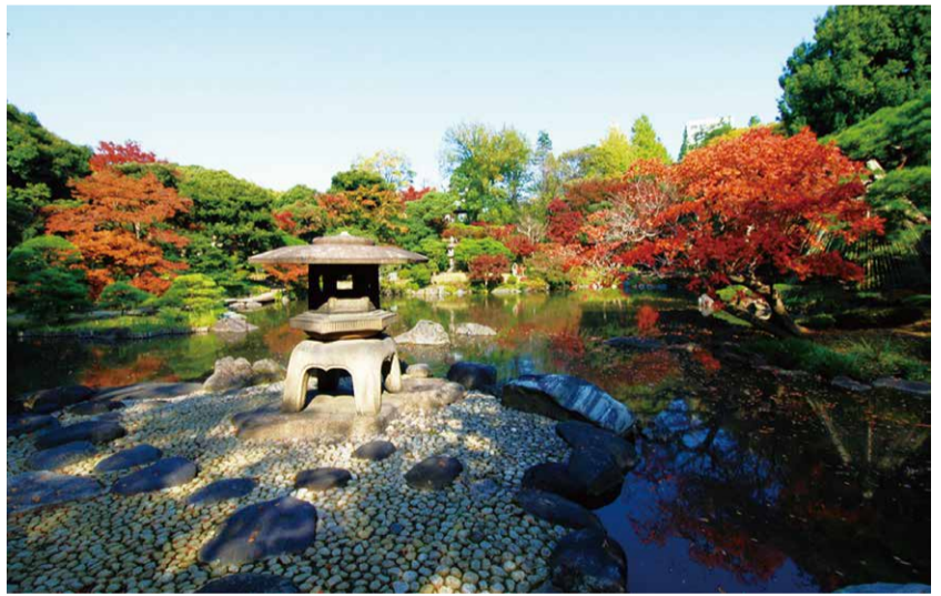
11月 紅葉(旧古河庭園)