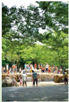
7月 水遊び(飛鳥山公園)