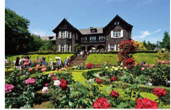
5月 春のバラフェスティバル