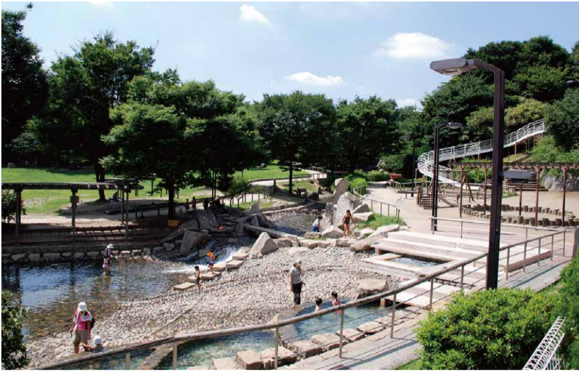
7月 水遊び(清水坂公園)