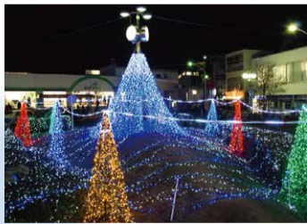
11月～12月 駅前イルミネーション