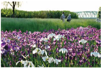
6月 荒川土手の花菖蒲