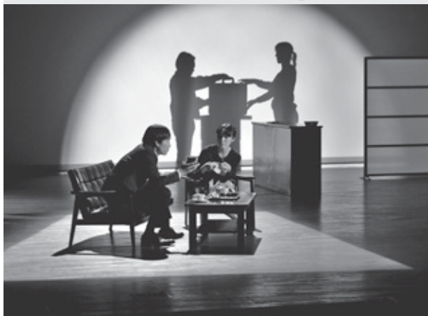
※大賞受賞作品は舞台化の予定です。