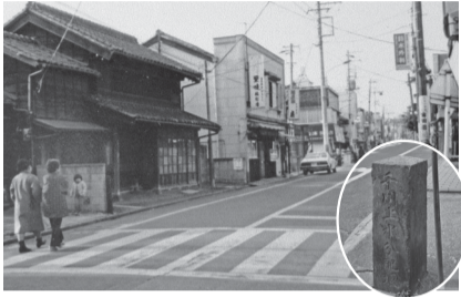
昭和50年代頃の中山道と千川上水分配堰碑