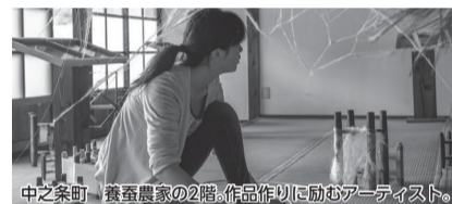
中之条町 養蚕農家の2階。作品作りに励むアーティスト。

[イベント内容] 温泉街や木造校舎など町内各所で絵画、彫刻、写真、インスタレーション等の展示、ワークショップやパフォーマンスを開催 日 9月9日(土)~10月9日(祝)の31日間 ※無休 場 群馬県中之条町 町内各所 問 中之条ビエンナーレ実行委員会事務局(イサマムラ内) ☎0279(75)3320(月~金曜 午前9時~午後5時)