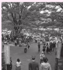
昨年の王子会場の様子