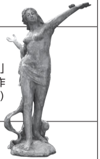
「平和の女神像」 北村西望作 (飛鳥山公園)

記事の見方 対象日 日時 会場 内容 講師 定員 費用(記載のない場合は無料です) 申込方法 問い合わせ 先申込先 HP ホームページ EM Eメール