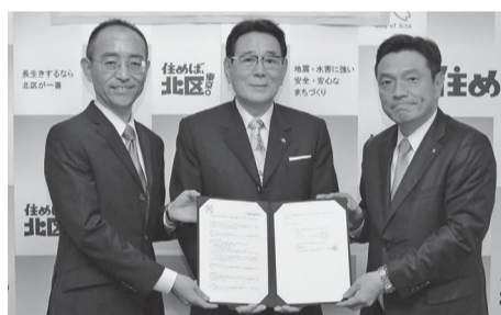
小島味の素(株)研究開発企画部長(左)、深瀬味の素(株)東京支社長(右)、北区長(中央)