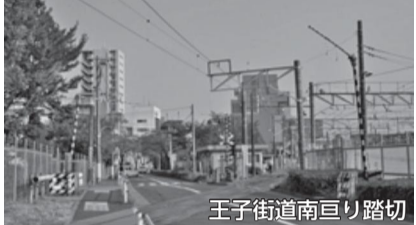
王子街道南回り踏切