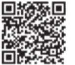
マイ広報紙北区 Android版