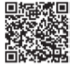
マイ広報紙北区 iOS版 (iphone, ipad)